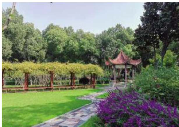
省委党校校园园林绿化养护服务项目