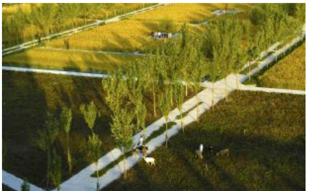
8.在沈阳建筑大学的校园景观设计中,借助稻田元素定义校园的形态,将生产性景观引入城市校园环境。