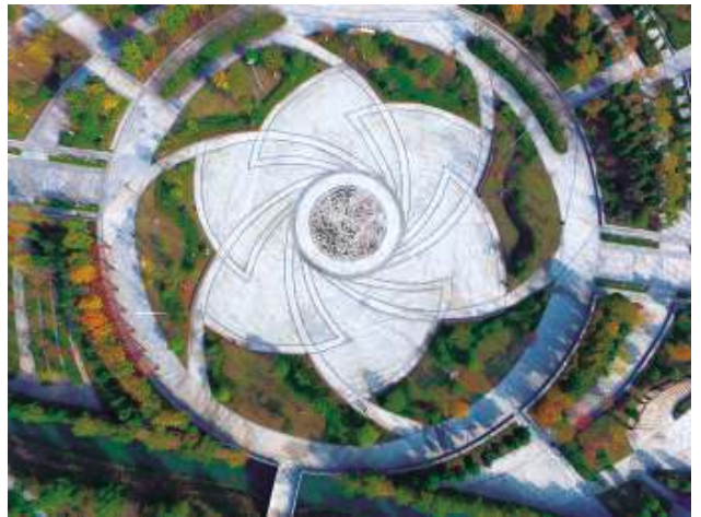
图4 “水舞风丹”中央广场

矿，但是铜陵也有窈艳柔美的一面——风丹花。风丹，又名铜陵牡丹，素与白芍、菊花、茯苓并称为安徽四大名药。广场设计以此为文化切入点，取“风丹花”的形与意，以“水舞风丹”为主题路线。运用抽象的表现手法来呈现前卫的设计理念，是景观、文化、生态完美融合的环境艺术。以盛开的凤丹为境，提炼波浪形的花瓣，形成景观性的语言。凤凰牡丹地雕栩栩如生，犹如两只凤凰携着盛开的凤丹起舞，欲从广场的中心升起、盛开，这种舞动的氛围瞬间带动整个广场。