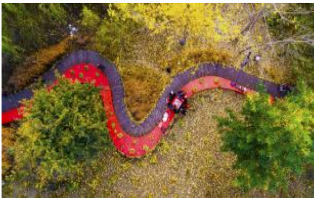
7.在秦皇岛市的河流整治过程中,引入一条“红飘带”,将杂乱无章的自然环境改造成有序的城市公园。