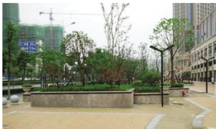
2018 年度优秀工程园林杯“合肥汇银广场室外景观绿化工程”