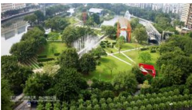
9.浙江衢州鹿鸣公园,采用“都市农业”概念,结合作物轮作的种植方式和低维护花田,保留了场地的农田生态和乡土文化的格局与过程,创建了一个充满活力的城市公园。