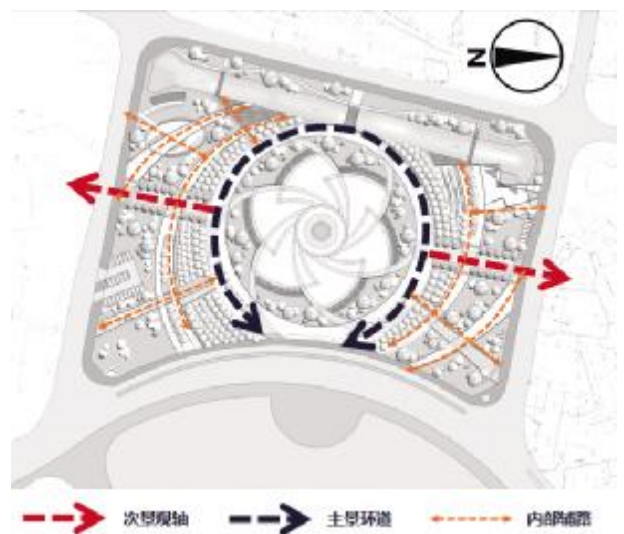
图5 环形道路路线示意图

铜陵市民广场项目是对城市广场设计形式的一个新的探索和尝试，是打破传统布局，营造新颖艺术、表现文化内涵的多点式生态环境艺术创作。华艺园林在保持创意设计、营造水平和智慧生态艺术原创能力上，坚持以人为本，智慧链接人与自然和谐共生，营造美丽景观、美好生态，努力构建人与自然和谐环境健康发展。