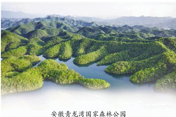
安徽青龙湾国家森林公园

2016年4月,习近平总书记到安徽省调研,强调唯改革才有出路,改革要常讲常新,勉励安徽加强改革创新,努力闯出新路。