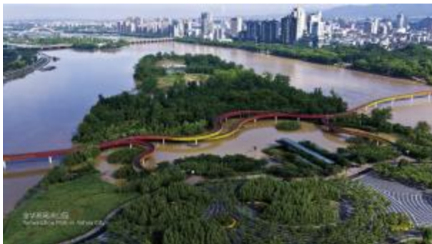
3.浙江金华市的燕尾洲,塑造具有水韧性的地形设计和种植设计,适应了季节性洪水要求。