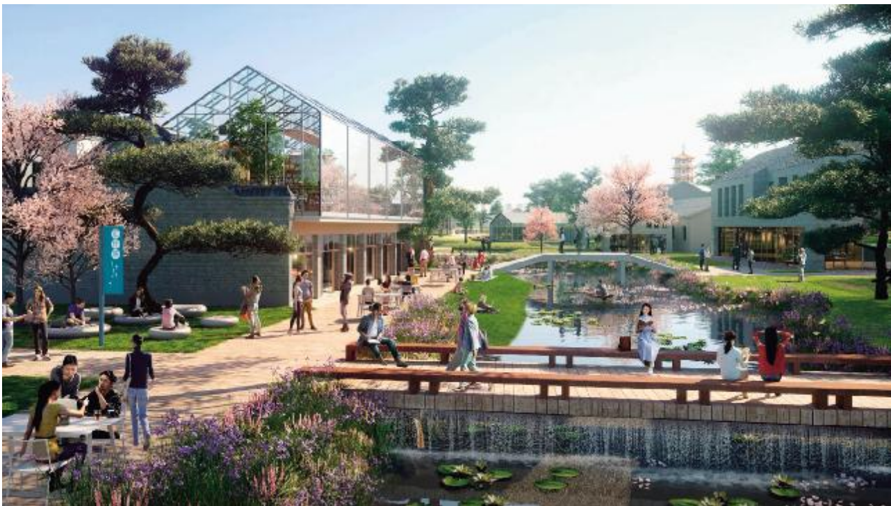
塘江学习公园——让终生学习的空间散布在景观里