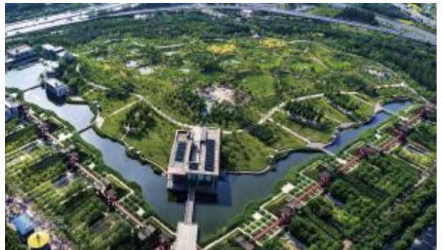
6.天津桥园公园天津桥园公园项目中,通过基于自然的土壤修复,开启了自然修复的过程。