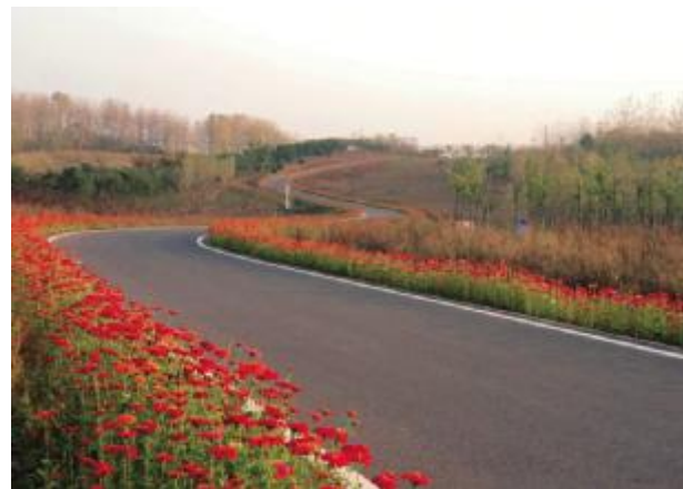
滁河干渠沿线生态绿化二期及大姚路绿化工程施工项目