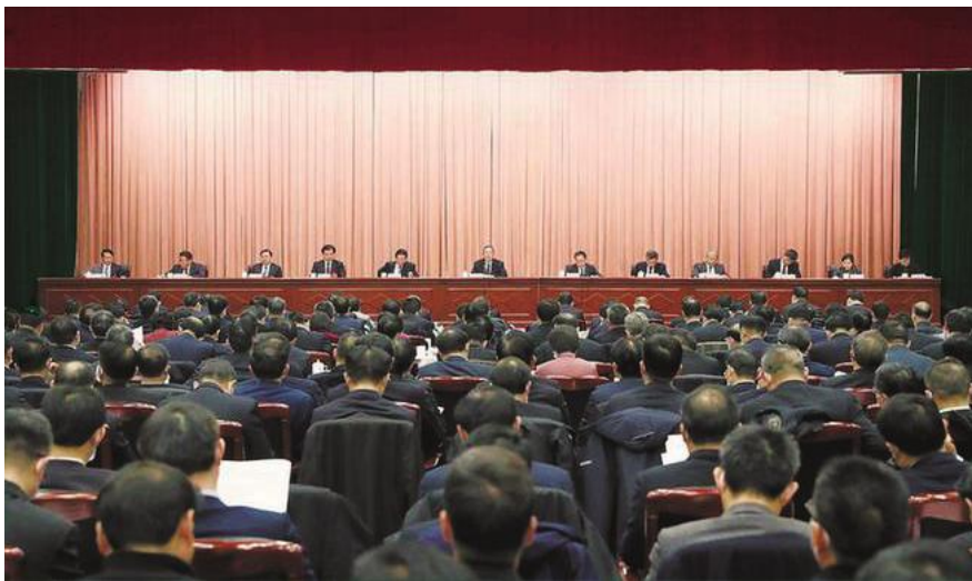
12月23日,省委经济工作会议在合肥召开