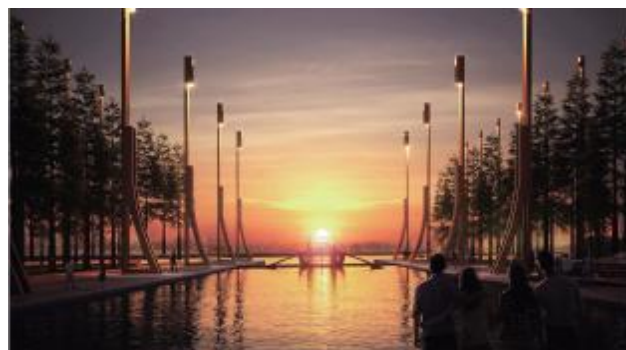
嘉善塘+平湖塘:红船精神,不忘初心 融合后工业开发,田园城市,定义新红色大美嘉兴

该项目位于浙江省嘉兴市,第一阶段约 15km 2 ,第二阶段 306.85ha。