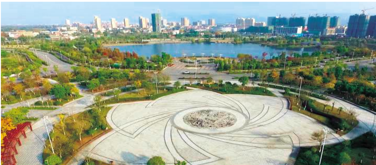
晨光初照映金辉 凤丹起舞欲翩飞