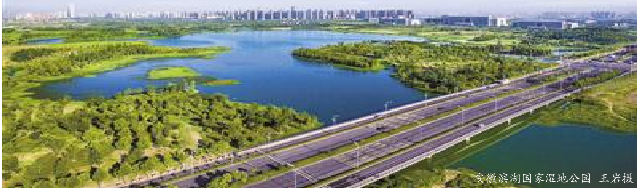
安徽滨湖国家湿地公园

除了林长,相关省、市、县直部门作为各级林长会议成员单位,在政策谋划、项目支持、资金投入、监督考核等方面协调联动。