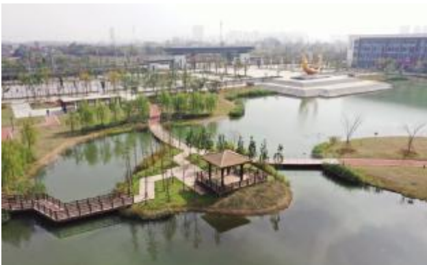
合肥职业技术学院合肥校区景观绿化工程

荣获由安徽省风景园林行业协会颁发的“2019年度安徽省风景园林徽园杯养护类金奖”。