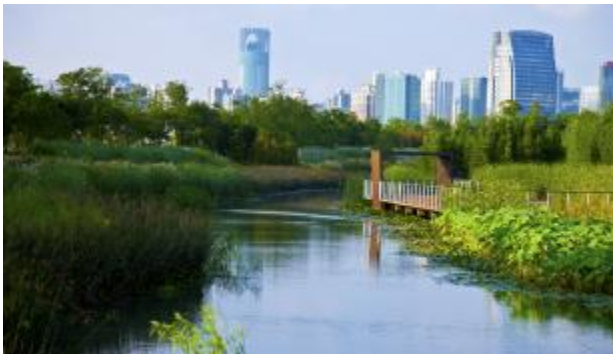
5.上海黄浦江沿岸的后滩公园,设计中形成可再生性景观系统,不仅修复了受污染的河道及退化的滨水区,还兼顾了美学价值。

风景园林联合会委托颁发的杰里科爵士奖证书。这无疑是他本人,更是全体中国园林人的骄傲!特别是对景观设计大师生态修复之旅的赞赏,充分体现国际上对中国城乡环境建设成果的充分肯定。