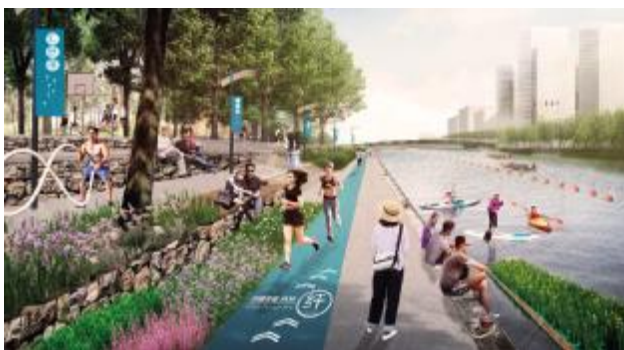
长纤足迹——重新诠释纤夫与水岸的现代意义