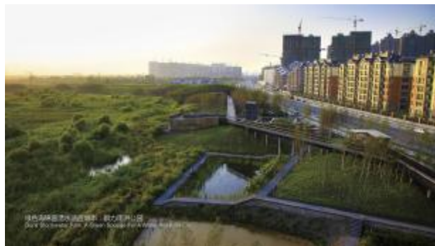
2.哈尔滨的群力湿地公园变成“绿色海绵”,可过滤并储存城市雨水,力促整座城市的可持续发展。