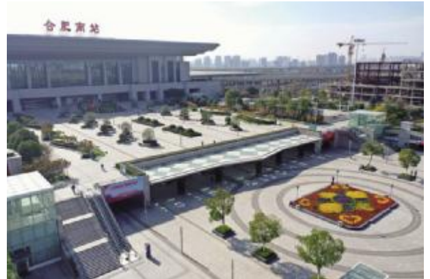
合肥高铁南站设施类综合营养服务

荣获由安徽省风景园林行业协会颁发的“2019年度安徽省风景园林徽园杯规划设计类优秀奖”。