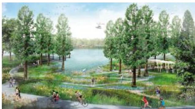
龙抬头 凤凰洲——让水的律动来激活岸线的美