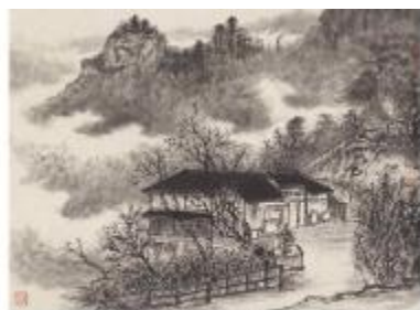
“两轴连一环，三区抱九园”的设计理念，旨在通过轴线串联起各个主题园，体现古代“园中园”的设计构思。整体景观呈现“两轴连一环，三区抱九园”的空间结构。

项目分为“风”“雅”“颂”三大景观区，再以轴线为骨架穿插小的主题园中，体现古代“园中园”的设计构思。整体景观呈现“两轴连一环，三区抱九园”的空间结构。