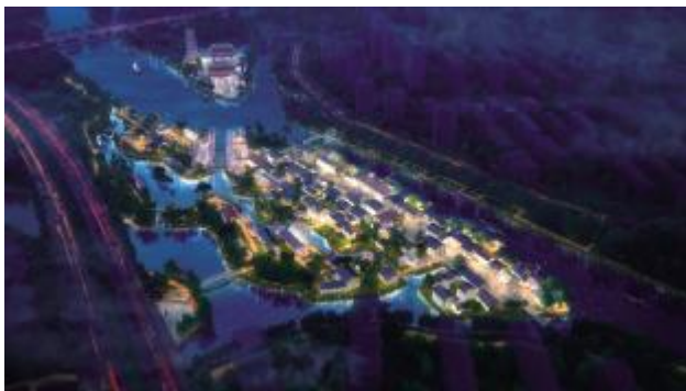
长纤塘:纤夫文化,紧系国家发展轴线,船歌思语,交织古今框架,创新江南