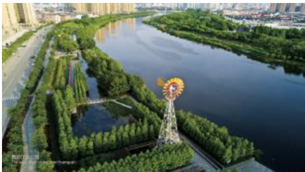
1.在浙江台州永宁江,将水泥驳岸重新设计为生态堤岸,城市河道成了“雨洪公园”,削减至少一半的洪峰流量。

2020 年 10 月 8 日的线上+线下颁奖仪式上,俞孔坚从北京大学校长郝平手中接受国际景观学与