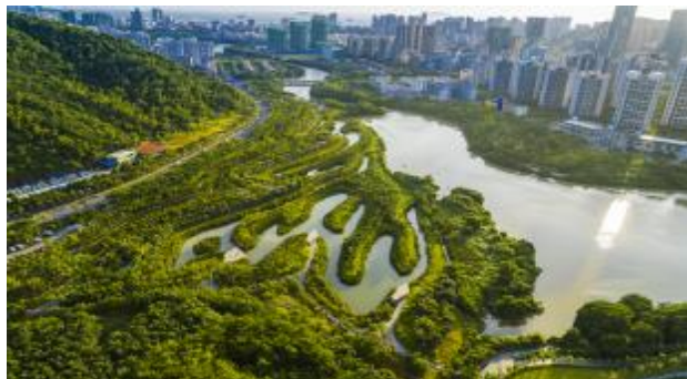
4.海南三亚市的东岸湿地公园,采用简单的挖填方法,外围设计中利用基础水塘链接,截流和过滤城市周边水体径流,在公园中心建造人工岛,种植榕树营造水上森林。