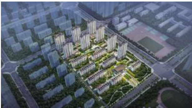
固镇·汉城源筑居住区鸟瞰图

安建汉城源筑位于环境优美，人文荟萃，文化积淀丰厚，历史遗存众多的固镇县。项目以“新亚洲”风为整体风格，基地内部地势平坦，周边配套设施齐全、交通便利。倚学府之畔、聚谷阳之美、忆汉风文韵，景观设计因地制宜汲取当地文化，以诗经中的“风、雅、颂”作为整区的三大布局，提炼国学的精髓元素，传承汉风遗韵，为固镇新添一座富有汉代风韵气质端庄的书香府邸。