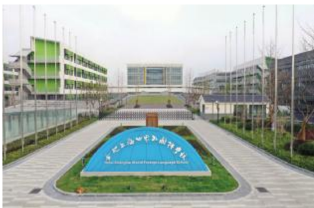
合肥上海世界外国语学校项目室外附属、室内装修工程中的绿化分项工程和幼儿园室外景观工程。