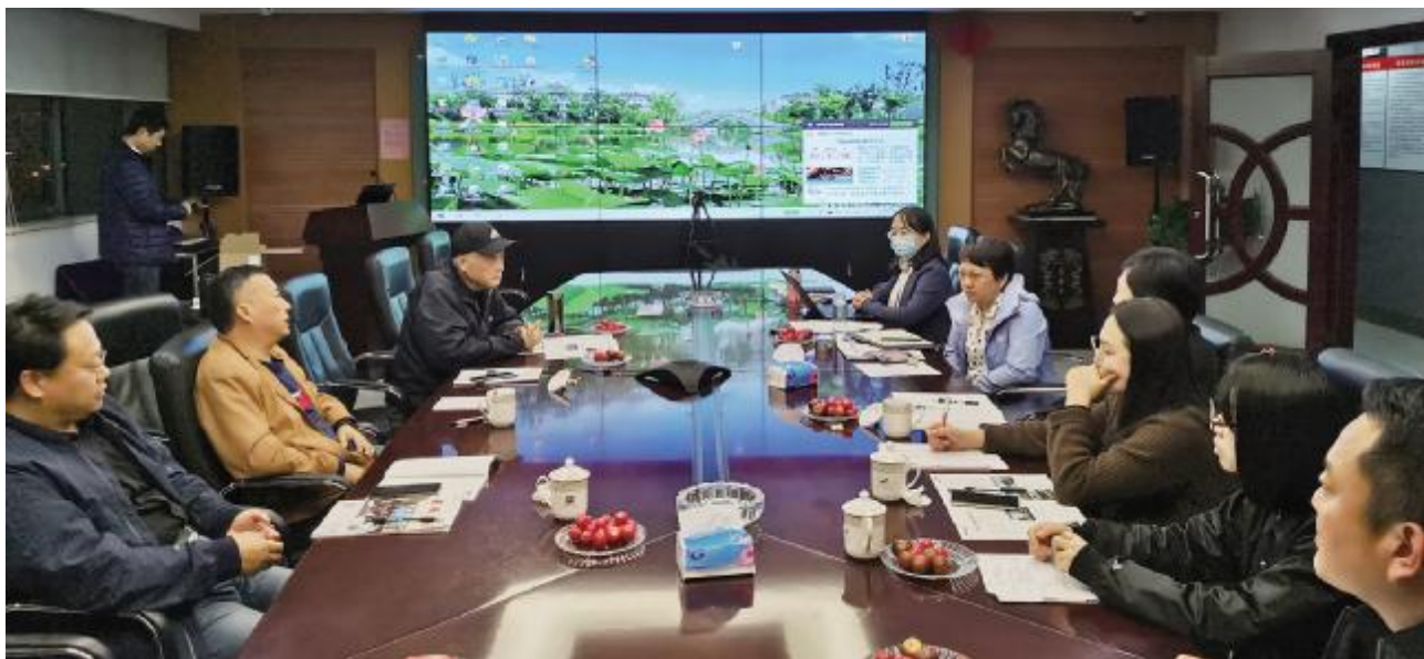
安徽省线下分会场

专卷编委会推荐《江西分册》三级目录大纲(节选)作为编写样本供各分册参考(详见附件)。请各省市结合自身特点,取长补短,继续推进编写工作,圆满完成《中国风景园林史》江南专卷的编写工作。