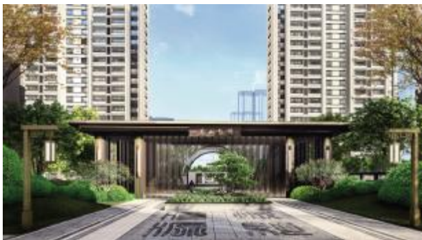
“关雎园”南山书院效果图