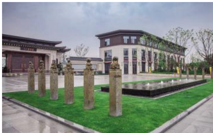
2019 年度优秀工程园林杯“阜南县奥莱壹号院景观绿化工程”