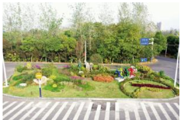
蜀山区 2018 年(上半年)花境建设设计施工一体化(2标段)