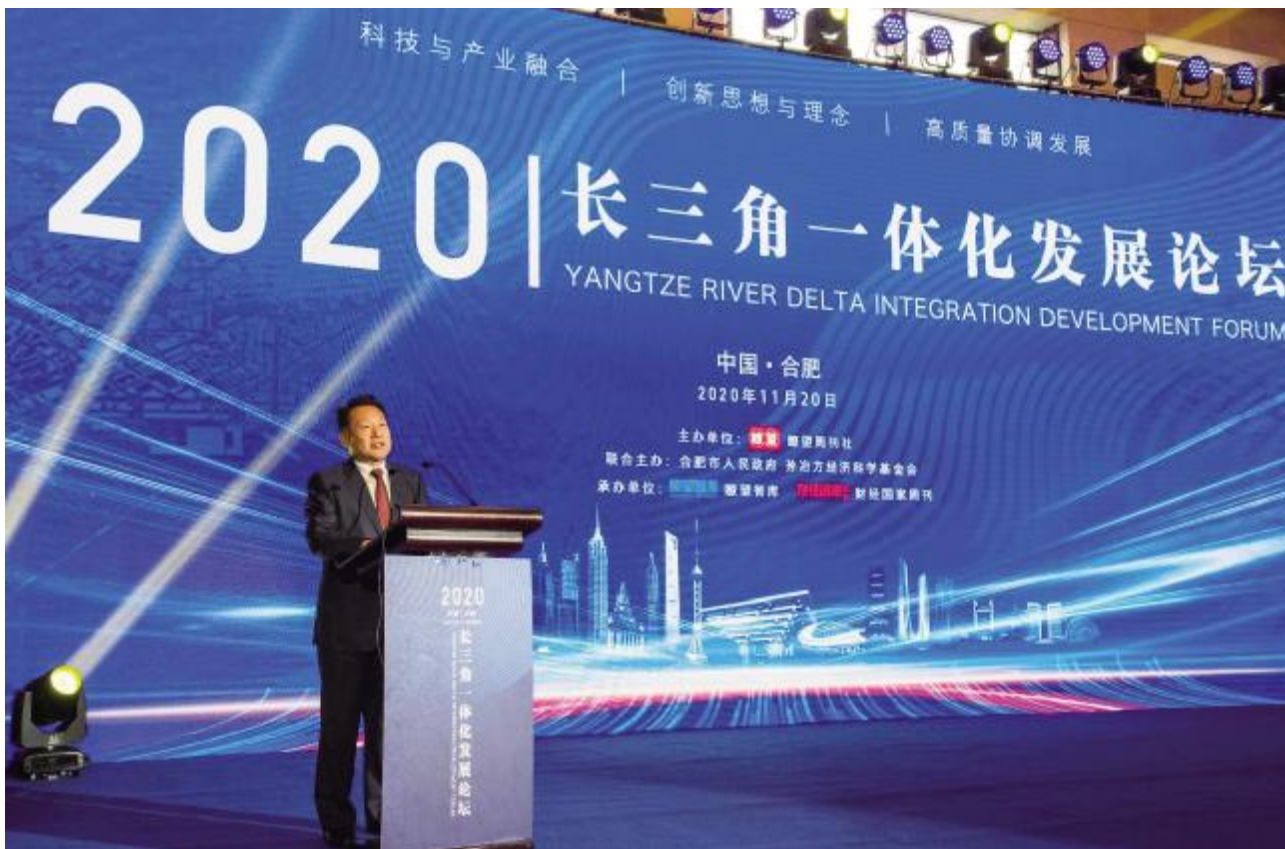
本文作者在大会上演讲

创新、成于实干。两年前，习近平总书记亲自擘画并在首届进博会开幕式上宣布长三角一体化上升为国家战略。2020年8月，总书记又在合肥主持召开扎实推进长三角一体化发展座谈会。总书记的亲切关怀和这一重大战略的实施，对合肥来说，从过去“我们与长三角”，变成今天“我们的长三角”，一字之差，