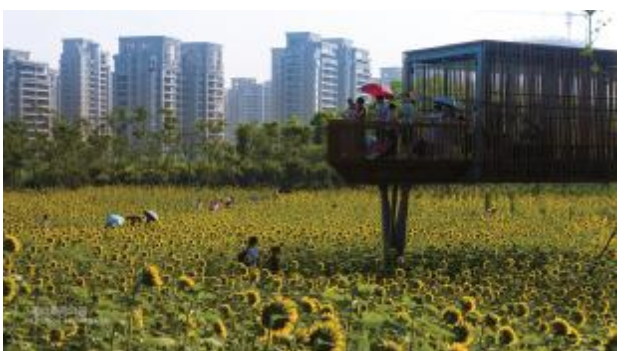
10.广东中山市岐江公园,实现了工业遗产保护与现代艺术的完美结合,将原有建筑与其它构筑物融入新景观,绿化仅增加部分乡土植物,原有植被与自然栖息地均被保留,原有的机器设备、码头等也都保留下来,赋予了新功能,延续了美育价值,传达出“野草之美”的环境伦理。