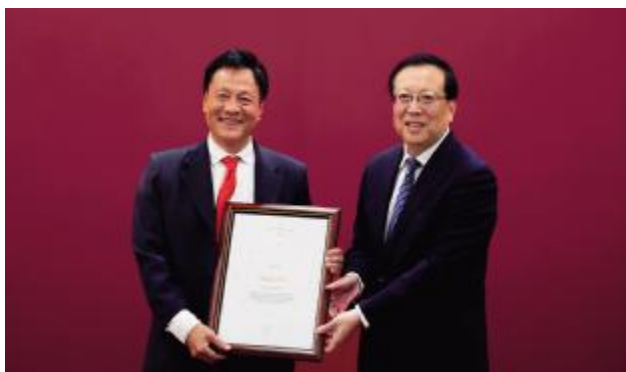
北京大学校长郝平(右)为俞孔坚教授颁奖