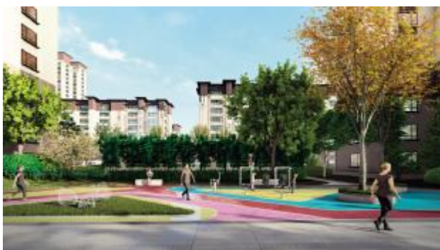
“行露园”跑道入口效果图