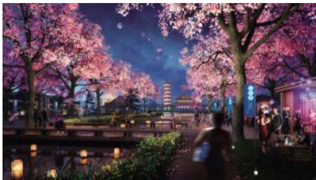
樱林杉影望普陀——由传统借景来映照绝美空间