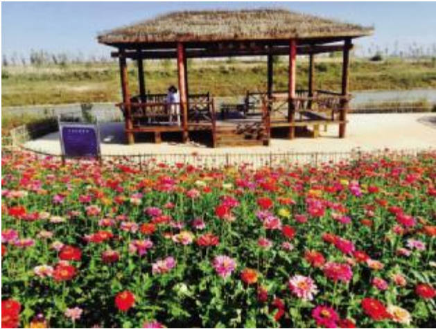
滁河干渠沿线生态绿化二期及大姚路绿化工程施工项目

荣获由合肥市林业和园林局、合肥市风景园林学会颁发的“2019年度合肥市广玉兰杯优质园林绿化项目奖”、由安徽省风景园林行业协会颁发的“2020年第一批安徽省园林绿化工程施工安全质量标准化示范工地”、“2019年度安徽省风景园林徽园杯施工类银奖”。